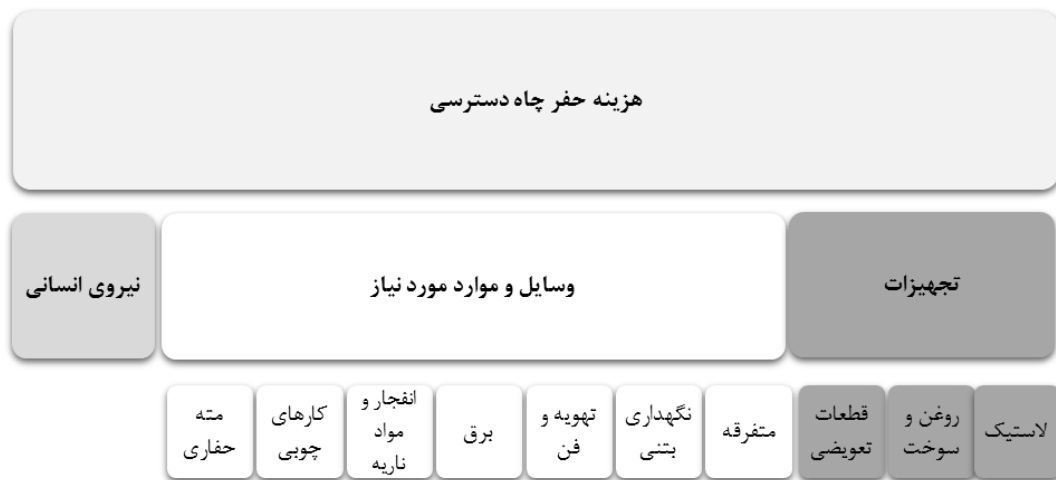
شکل ۱: هزینه حفر چاه دسترسی و زیر مجموعه‌های هزینه حفر چاه [۱۰]